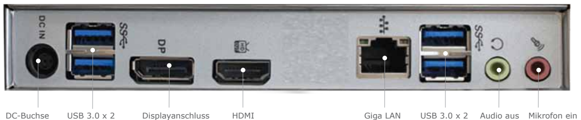
DC-Buchse USB 3.0 x 2 Displayanschluss HDMI Giga LAN USB 3.0 x 2 Audio aus Mikrofon ein