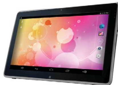
Eingebauter Akku gibt dem Anwender eine neue Bewegungsfreiheit