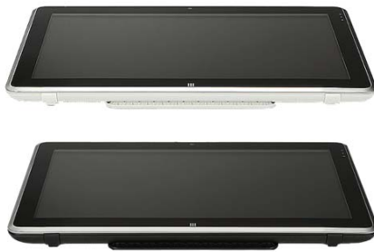
Schwarzes oder weißes Gehäuse