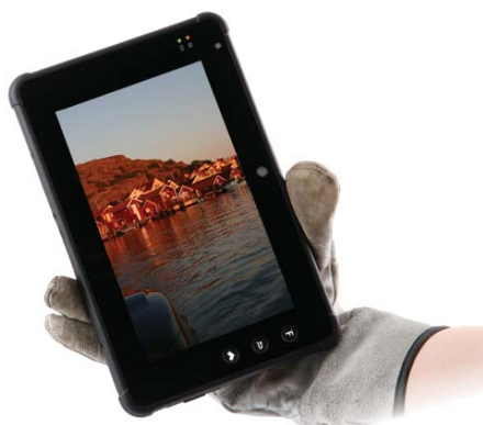
700 nits Display, hell und scharf, auch in direktem Sonnenlicht