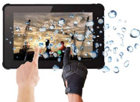
Regenmodus für die Arbeit bei Regen und Schnee, mit oder ohne Handschuhe