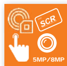
Lesern & Kameras