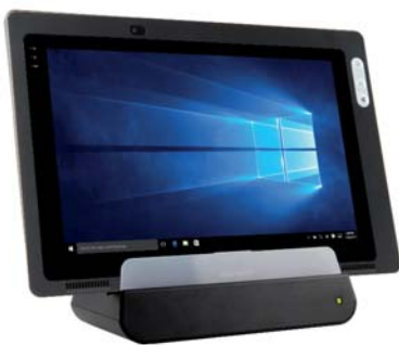
Dockingstation mit Anschlüssen – ein praktisches Zubehör