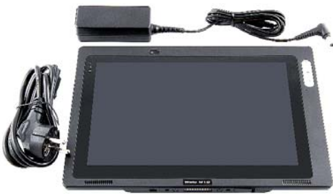
Standard Lieferumfang inkl. Ladegerät