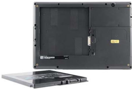
Leicht austauschbarer Akku