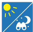
Sonnenablesbares Display mit Nachtsicht