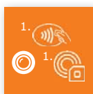
Lesern & Kameras