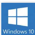
Windows® 10 IoT