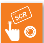
Lesern & Kameras