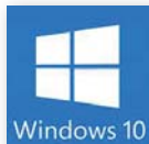
Windows 10® IoT