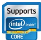
Intel quad core inside

Dieses robuste und vielseitige Tablet ist nach IP65 und MIL-STD-810G zertifiziert und verfügt über patentierte Funktionen. Leicht zu öffnende E/A-Port-Abdeckungen, integrierter Ständer und zwei Hot-Swap-Akkufächer für beispiellose ununterbrochene Laufzeit. Der MR14 ist leistungsstark, anpassungsfähig und elegant. Er ist sowohl im Büro, als auch im Außendienst, zu Hause.