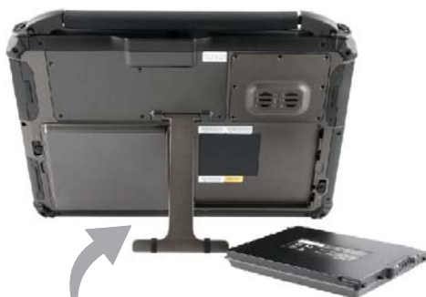
Integrierter Tischständer rückseitig