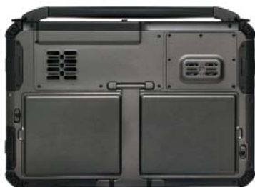
Zweifachakku für hohe Laufzeit