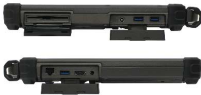
Anschlüsse unter Abdeckklappen