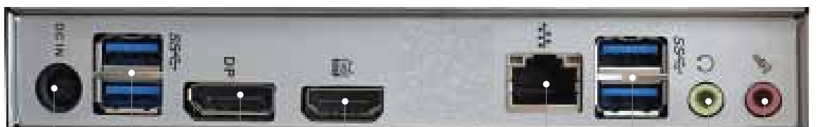
DC-Buchse USB 3.0 x 2 Displayanschluss HDMI Giga LAN USB 3.0 x 2 Audio aus Mikrofon ein