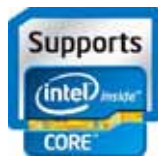
Intel Coffee Lake