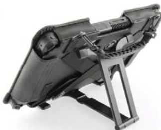
Tragegriff 3) und Aussentasche mit X-Strap 3) mit einfachem Ständer 3)