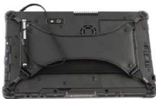
Stift und X-Strap mit Stifthalter 3)