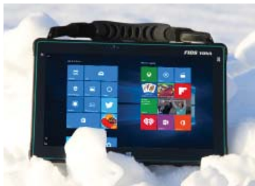
Robust und sicher. Mit montiertem Handgriff 3)