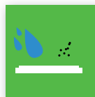
Geschützt gegen Wasser und Staub