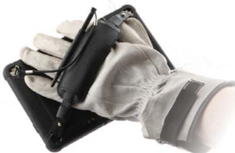
Einfach zu Handhaben