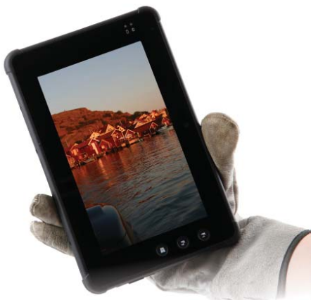
Klarer heller Bildschirm