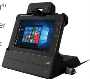
Tisch-Docking 4) mit USB, HDMI, Serieller Schnittstelle und Ethernet