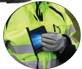
Passt in die Tasche!