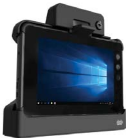
KFZ-Halterung 4) mit USB, HDMI, Serieller Schnittstelle und Ethernet