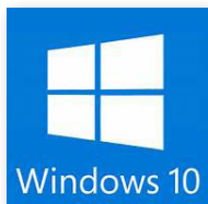
Microsoft® Windows® 10

Der Welo XR8 kann auch mit Barcodelesern ausgestattet werden. Der besondere Tragegriff für Einhandbedienung ist Standard. Ein Tischständer mit Aufladung, USB Ports und Ethernet Verbindungsmöglichkeit, ist als Option ebenso erhältlich.