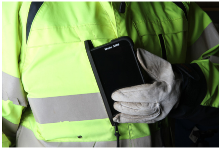
Schlankes Design, wenig Gewicht